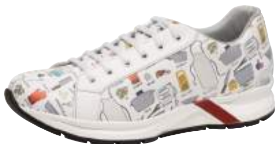
91184 Ramón Roteta