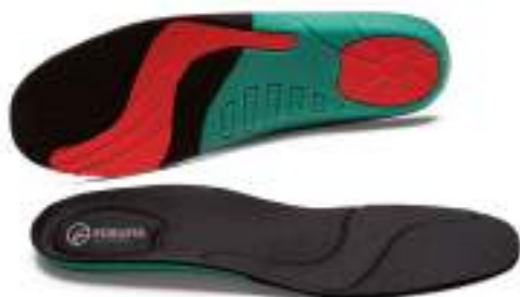
Plantilla Ayr Preventia®