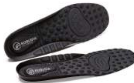
20451 Plantilla Ayr Integral