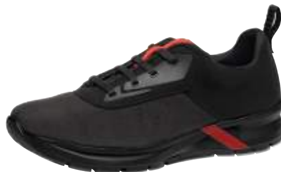
91203 Iñigo Lavado