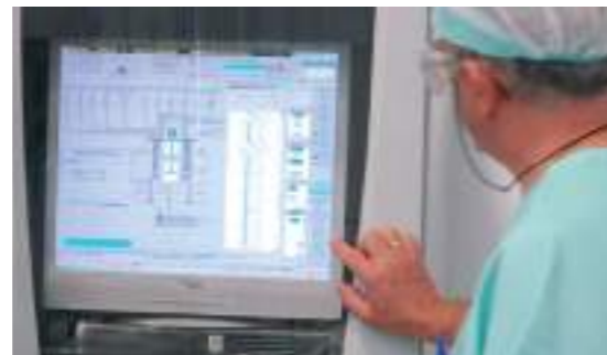
PROCESOS INDUSTRIALES INTEGRADOS