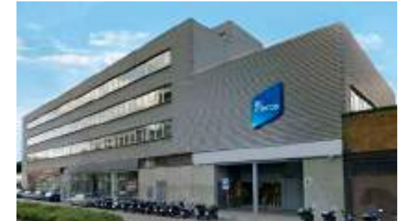
EDIFICIO SEDE CENTRAL, BARCELONA

Grupo internacional , con sede en Barcelona, cuenta con 12 filiales propias, más de 1000 empleados y presencia de sus marcas en más de 50 países.