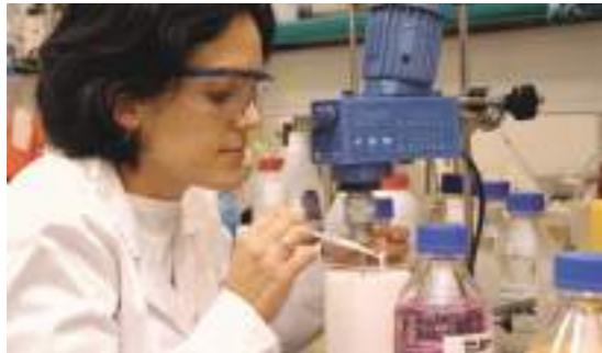
EN LA VANGUARDIA DE LA INVESTIGACIÓN